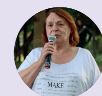
Monique BROCHOT ancienne Maire de Mantes-la-Ville