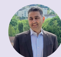
Lahsen ZBAYAR président du Parlement populaire de circonscription