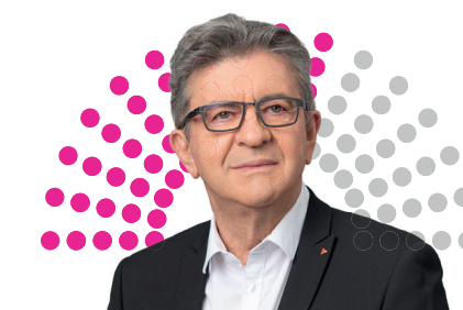
AVEC JEAN-LUC MÉLENCHON C'EST :