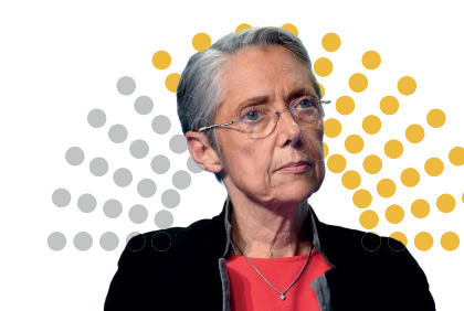
AVEC ELISABETH BORNE C'EST :

Entre Elisabeth Borne choisie par Emmanuel Macron et Jean-Luc Mélenchon à la tête de la Nouvelle Union Populaire Ecologique et Sociale, vous avez le choix :